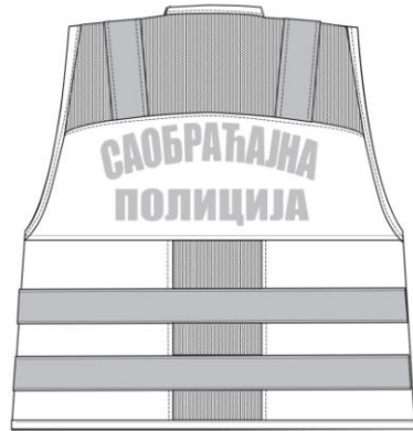
Izgled zadnje strane

Ukupna vrednost bez PDV-a PDV Ukupna vrednost sa PDV-om